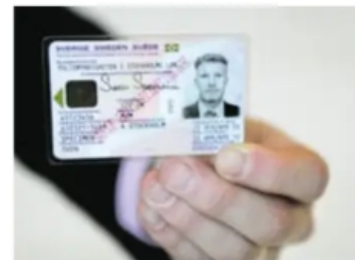
Säkrare identifiering ska utredas.