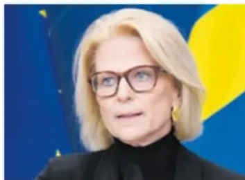
Finansminister Elisabeth Svantesson (M).

– På detta sätt kan man bedra till exempel äldre eller "mjölka" välfärdsve-