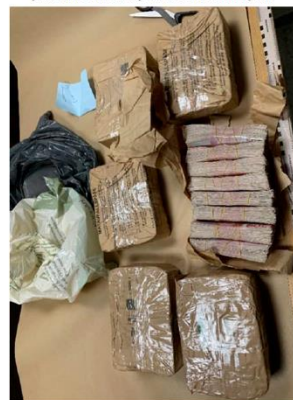
10. Bild visar hur pengarna var paketerade i matavfallspåsar.