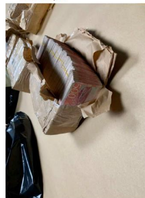
12. Bild visar hur pengarna var paketerade i matavfallspåsar.