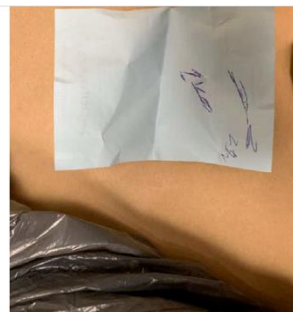
9. Baksida av pappret, "vänsterpartiet" låg i den vit/gröna påsen under matavfallspåsar.