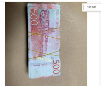
11. Bild visar en bunt med pengar och hur dessa satts ihop med gumminodd. I varje hög var det 100.000 kronor.